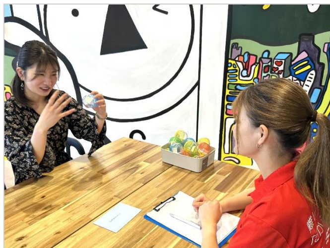
自分らしい服装で行うカジュアル面談