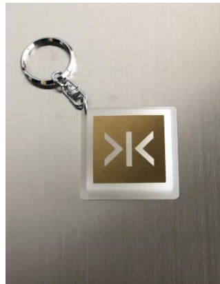
金のボタン <閉じる>