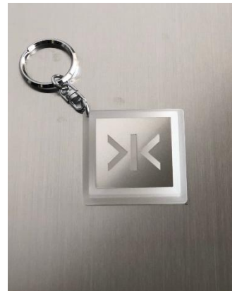
銀のボタン <閉じる>