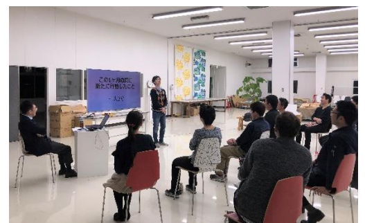
3分間スピーチの様子

また、毎回『魅力的な人』に成長するために必要な項目をテーマに、社長が経験談や考えをレクチャーし、その後テーマに沿った課題に