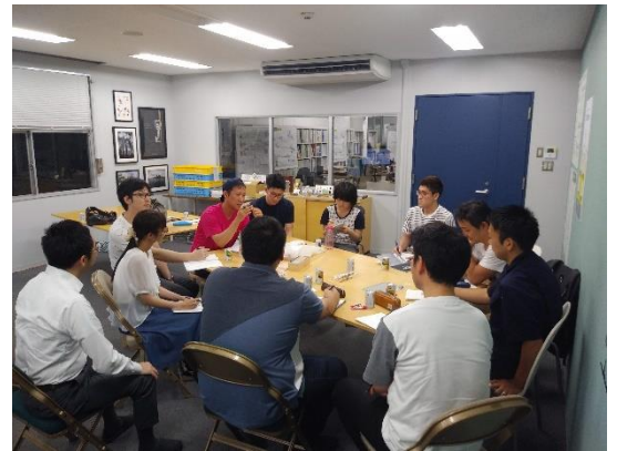
参加のきっかけを発表する参加者たち

また、参加者の中から、会社の理念やバリューなどを意識した言葉も聞かれるようになり、同じ価値観を持ち会社の目指す姿を意識して仕事に向き合う一体感が生まれていくことを期待しています。